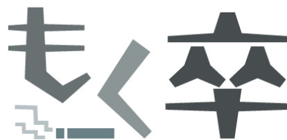
エムステージグループの禁煙支援制度

喫煙者のみならず、非喫煙者に向けた制度も取り入れることで、全社員の健康増進をめざしています。